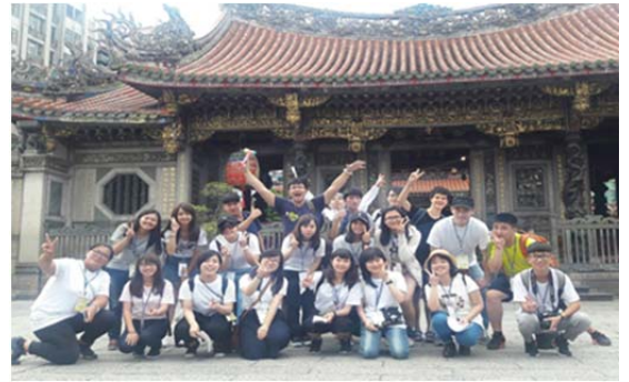
▲大好きな人たちと

書き尽くせないほどの貴重な経験と書き表せないほどの多くの感動を得た怒涛の7日間だった。このような貴重な経験をさせて頂いたことに心から感謝します。