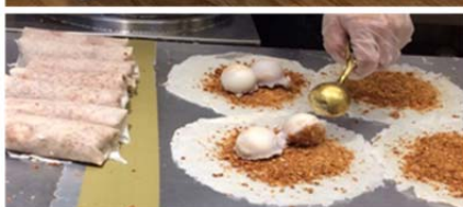
▲ピーナッツアイスクレープ