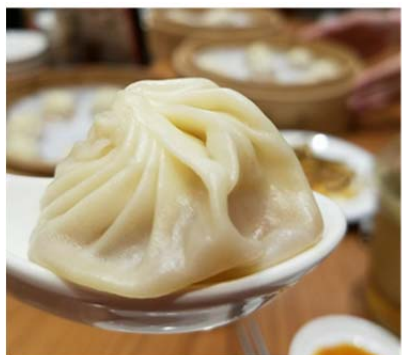
▲小籠包 ▼食井精緻盒餐(有名店)のお弁当

私には料理の説明をできそうにないので、ひたすらに写真を貼る。全てのものに言えるのは非常好吃 再来一椀！ということである。